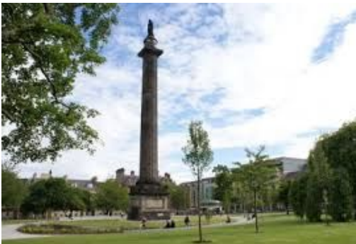
トラム終点から見える公園

Airlink100の終点からはWaverley駅への入口（写真中央）が見えていますので対向車線側へ渡り、スロープを降りて駅構内へお入りください。